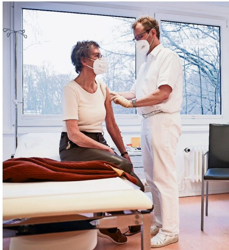
Ein Allgemeinmediziner verarztet in seiner Praxis eine Patientin. Das funktioniert in der Stadt gut, in ländlichen Gegenden schließen bald viele Praxen. Nachfolger werden dringend gesucht.