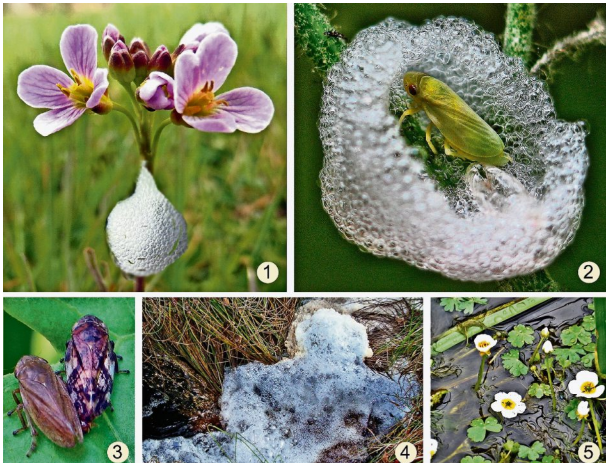
Schaumbildner in der Natur.

Ein weiter Schaumbildner in den Gewässern ist die Wasserpflanze „Flutender Hahnenfuß“ mit ihren auffälligen weißen Blüten, die deutlich über der Wasseroberfläche stehen (5). Diese Pflanzen bedecken häufig große Flächen und sie bilden Tenside,