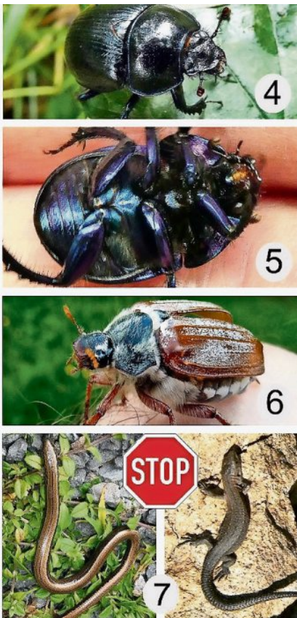
Insekten zum Anfassen.