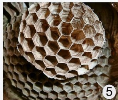
Kunstwerke der Natur – gesehen in Oerel, in Hipstedt, in Bremervörde und im Raum Basdahl.